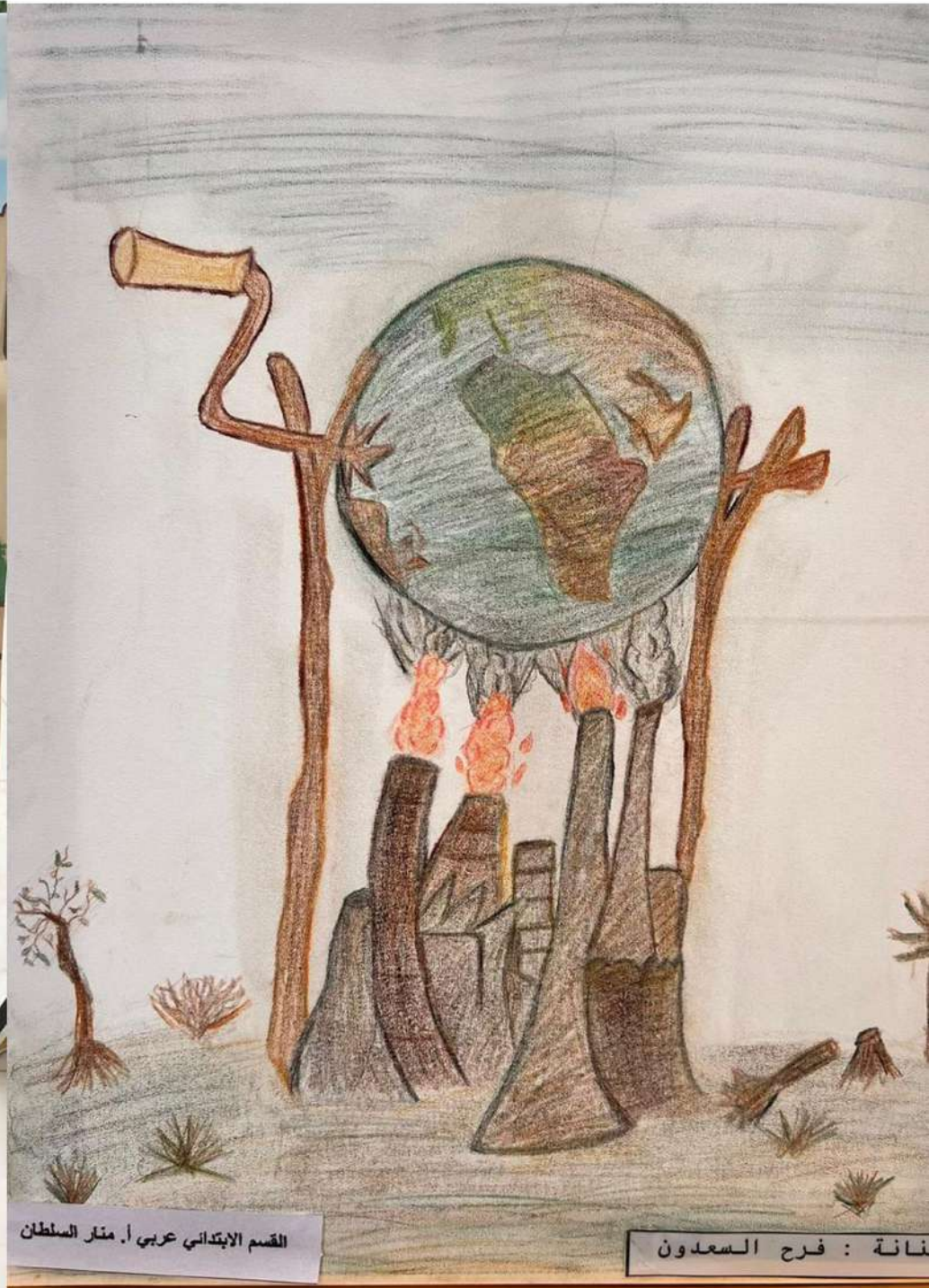
القسم الابتدائي عربي أ. منار السلطان