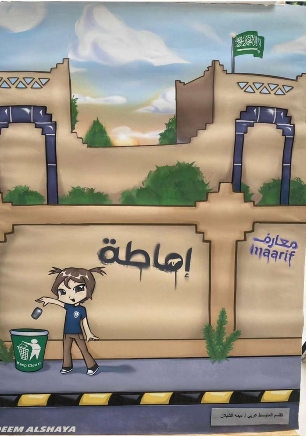
القسم المتوسط عربي أ. ديمه الشبلان